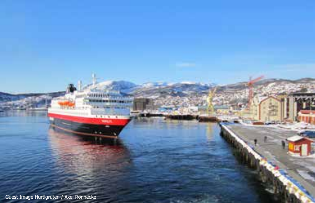
Guest Image Hurtigruten / Axel Rönnecke