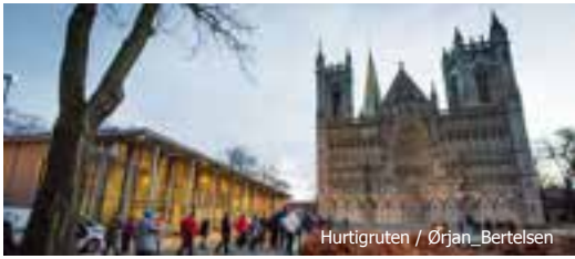
Hurtigruten / Ørjan Bertelsen