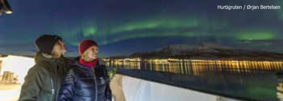
Hurtigruten / Norway King Crab Production AS