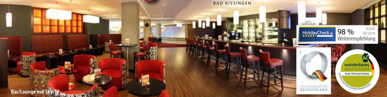
Bar/Lounge mit Sky-TV

PARKHOTEL CUP VITALIS ★★★★ BAD KISSINGEN