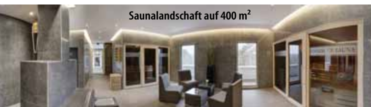
Saunalandschaft auf 400 m 2

* Die Kurtaxe (3,60 € p. P./Tag) ist vor Ort zu zahlen.