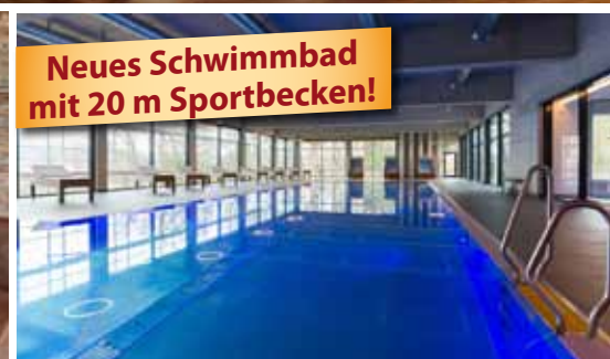
Neues Schwimmbad mit 20 m Sportbecken!

Das 4-Sterne-Parkhotel CUP VITALIS begeistert seine Gäste mit seinem einladenden Ambiente, der traumhaften Aussicht auf Bad Kissingen und die umliegenden Wälder, seinem großen SPA & Sportbereich sowie der 35.000 m 2 großen Parkanlage, die es umgibt.