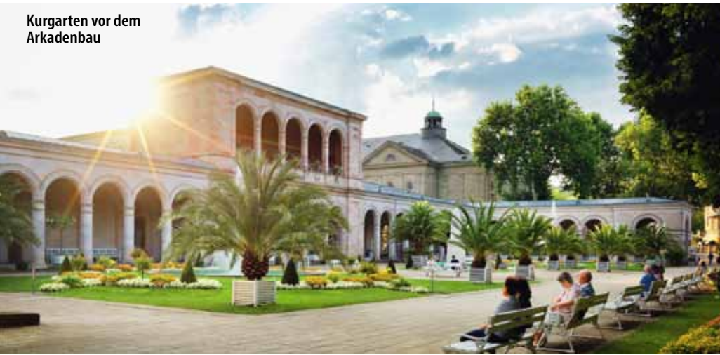
Kurgarten vor dem Arkadenbau