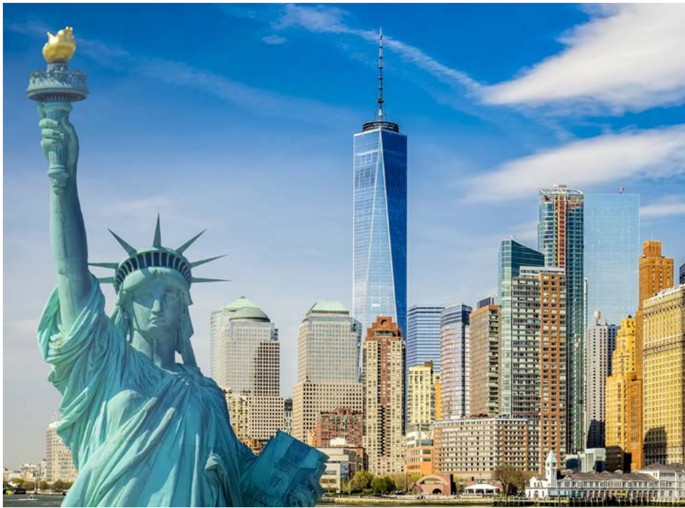
Die Freiheitsstatue und das One World Trade Center

gang durch Teile des Central Parks. Sie werden sich fragen, wo ist die gerade noch allgegenwertige Hektik der Metropole geblieben, so ruhig und wunderschön ist die grüne Lunge Manhattans, ein wohlkommender Gegenpart zum bisher erlebten. Am Abend dann gleich der nächste Höhepunkt. Die relativ früh einsetzende Dunkelheit lässt den Times Square zu einem Lichterspektakel werden. Und Sie mittendrin. Ihr Fotoapparat wird an seine Leistungsgrenzen geführt werden, so viele Eindrücke und traumhafte Ausblicke gilt es einzufangen. Danach besuchen wir zusammen ein gemütliches, typisches New Yorker Diner. Egal ob Burger oder Steak, für jeden wird das passende dabei sein. Gemeinsam lassen wir den Abend ausklingen (Abendessen nicht inklusive).