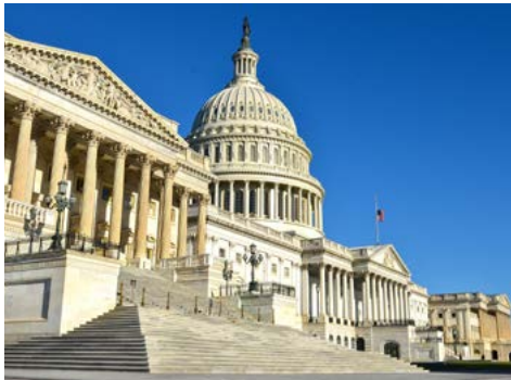
Das Kapitol in Washington (Zusatzausflug)