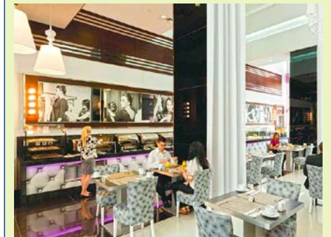
Frühstück in stilvollem Ambiente